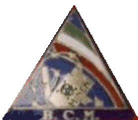
Spilla portata dai Rastrellatori nel 1945

L'estensore ha elaborato questi appunti traendo fatti e particolari da diverse fonti. Essi vogliono riassumere la storia dell'attività B.C.M. in Italia, affinché non ne vada perso il ricordo