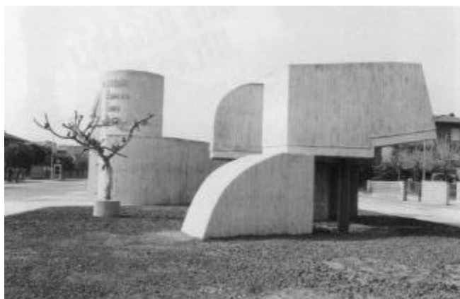
monumento ai caduti B.C.M. a Castel Bolognese (BO)